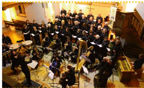
Die Kantorei der Evangelischen Kirchengemeinde Schramberg bei einer Probe